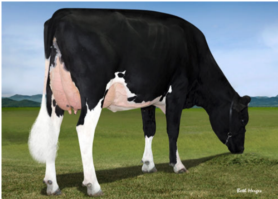
FAIRMONT TUFFENUFF RIDGE GRANDDAM