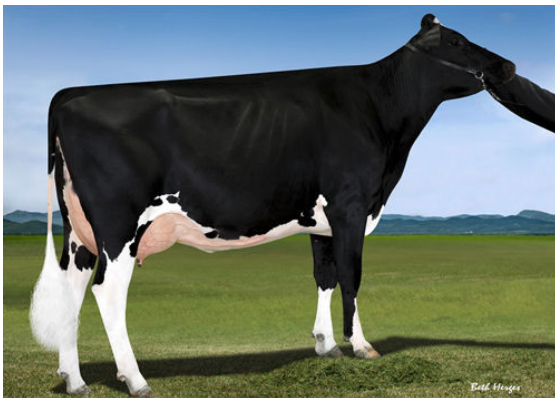
FAIRMONT TUFFENUFF RIDGE GRANDDAM